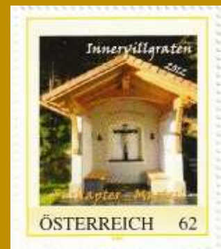
Kapelle mit Glockenstuhl 2022

Logo Fürhapter 2008 Pfarrkirche St. Martin 2009